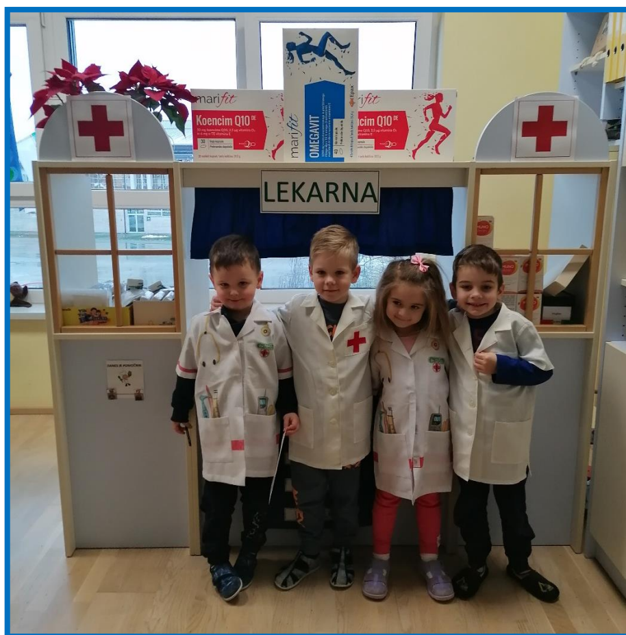
Foto : Naši uslužbenci LEKARNE