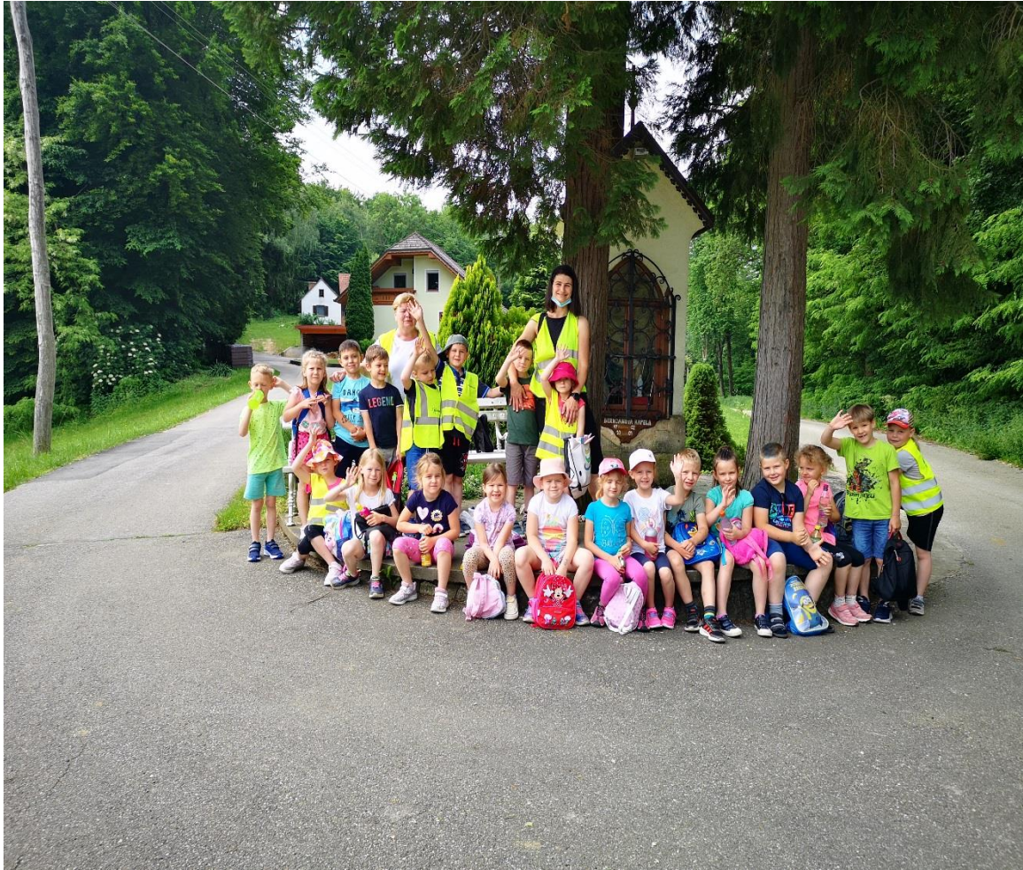
Ustavili smo se pri Bernjakovi kapeli, kjer smo se napili in male okrepčali.