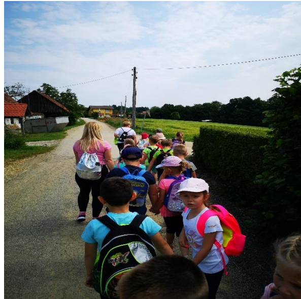
In nadaljevali po gozdu proti naselju Trstenik . Bili smo zelo blizu cilja.