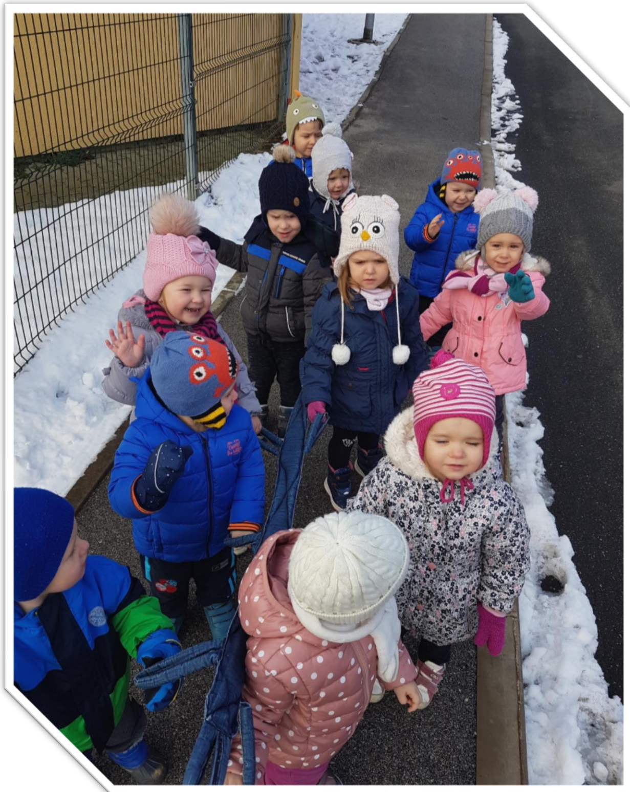
Z »bibo« na spehod v naravo...