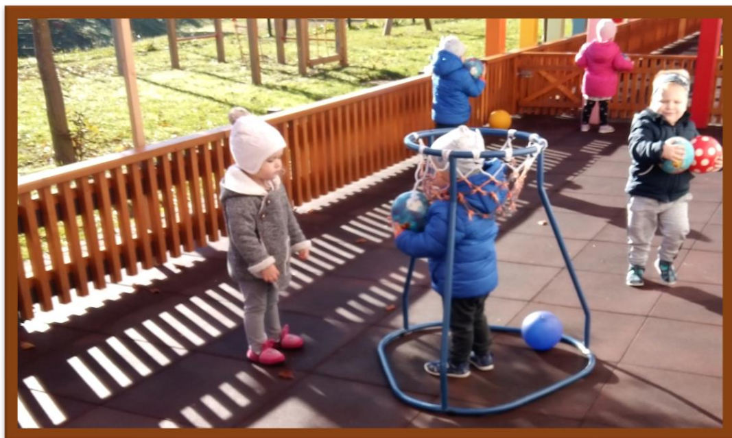
Igramo se na prostem ter mečemo žogo v koš in še kam...