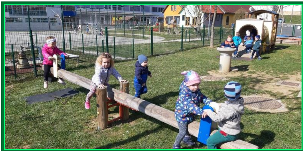
Zelo veliko se tudi gibamo na svežem zraku