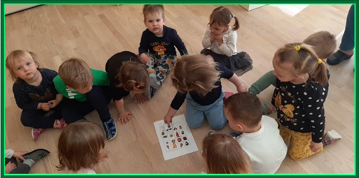
Iskanje parov: Kaj vse je gosenica pojedla