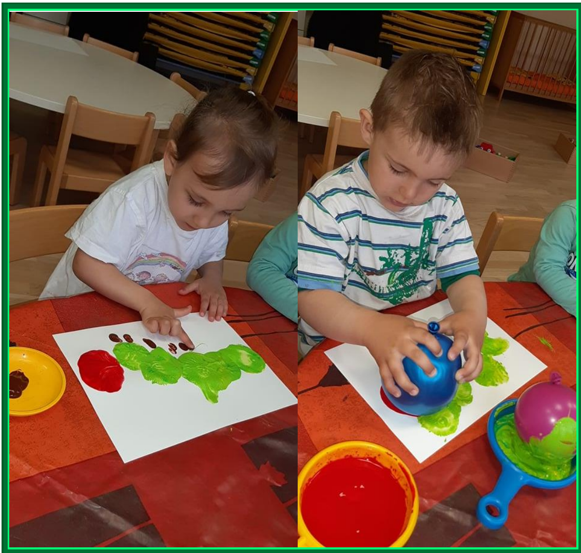
Slikanje gosenic z baloni

Ko v lonček sem pogledal, je notri ni bilo (pokažemo ni-ni), pred oknom pa je letal metuljček prelepo (posnemamo let metulja).