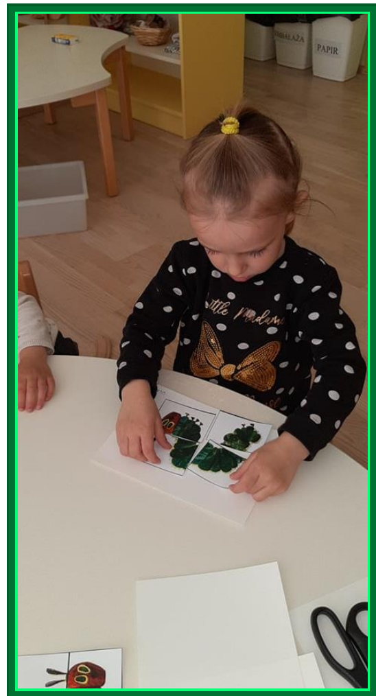
Sestavljanje in lepljenje gosenic