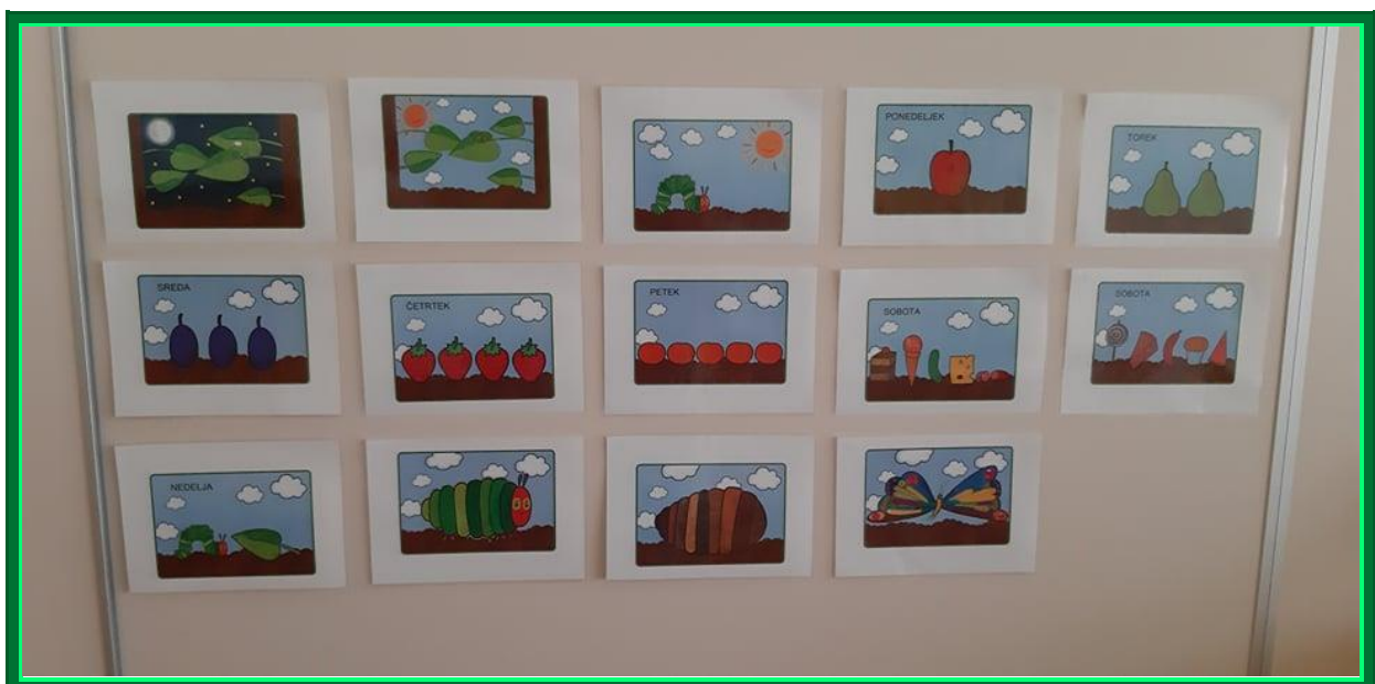
Zgodba v slikah: Zelo lačna gosenica

Spoznali smo zgodbo Zelo lačna gosenica . Naša gosenica Tinka, ki nas spremlja že vso leto, se je prelevila v zelo lačno gosenico, ki je pojedla vse, kar ji je prišlo pod zob. Skozi zgodbo smo spoznali, da ni vsaka hrana zdrava in da se po nezdravi hrani, kot so sladkarije, počutimo slabo in nas boli trebuh. Sike hrane smo razvrstili na zdravo in nezdravo. Skozi zgodbo veliko tudi štejemo, saj je gosenica vsak dan pojedla vedno več stvari, prav tako utrjujemo barve in spoznavamo različno hrano. Otroci s pomočjo slik tudi sami obnavljajo zgodbo.