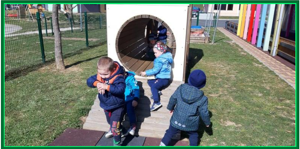
... in predor v vlaku