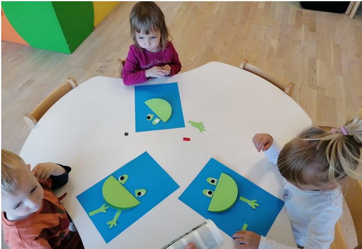
- sestavljanje in lepljenje žabe -

Naklonjeno nam je bilo vreme, šli smo v peskovnik. Otroci so razvijali svojo ustvarjalnost in motorične spretnosti. Bilo je veliko veselje.