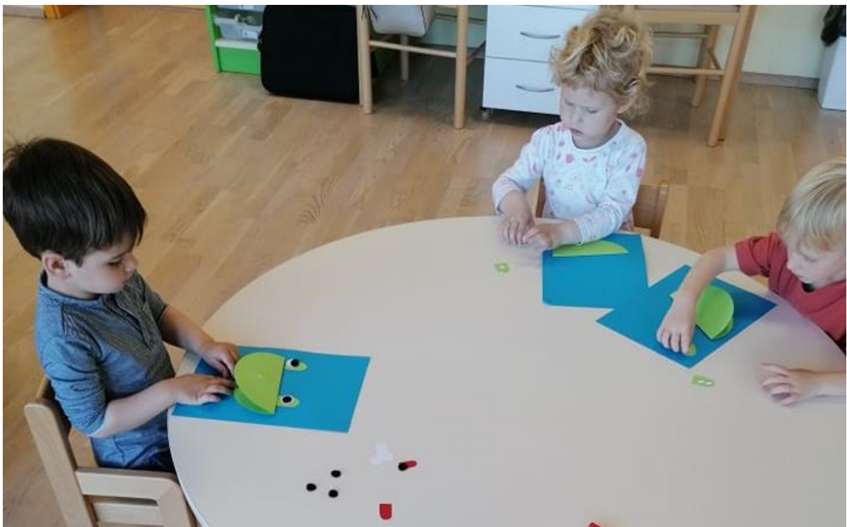
- sestavljanje in lepljenje žabe -