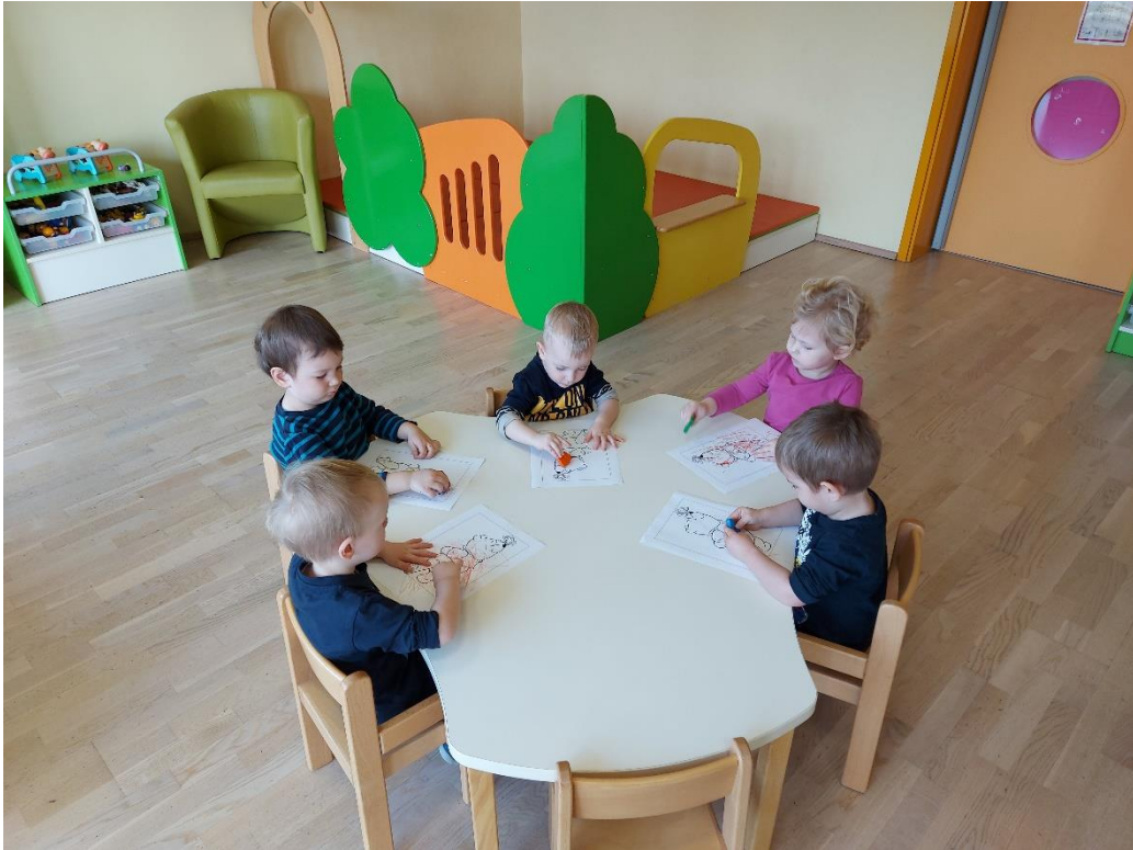
Pobarvamo mu medvedka za album.