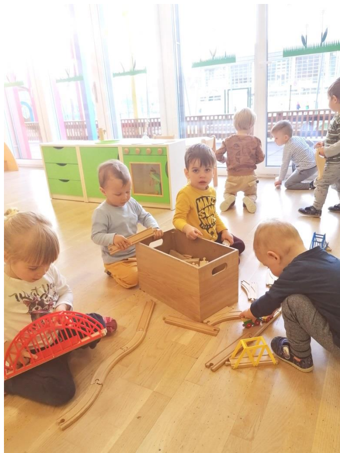
Igra z vlaki.