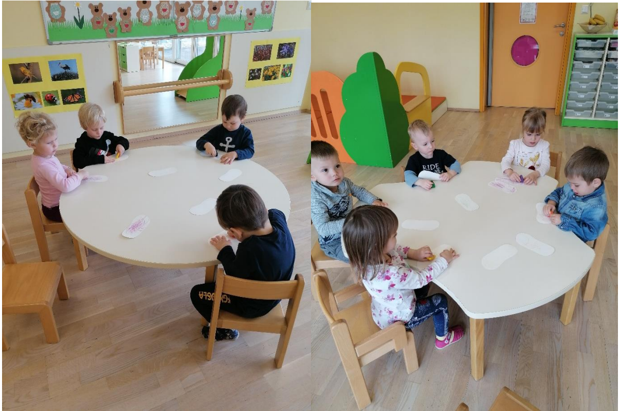
Copati v nastajanju.