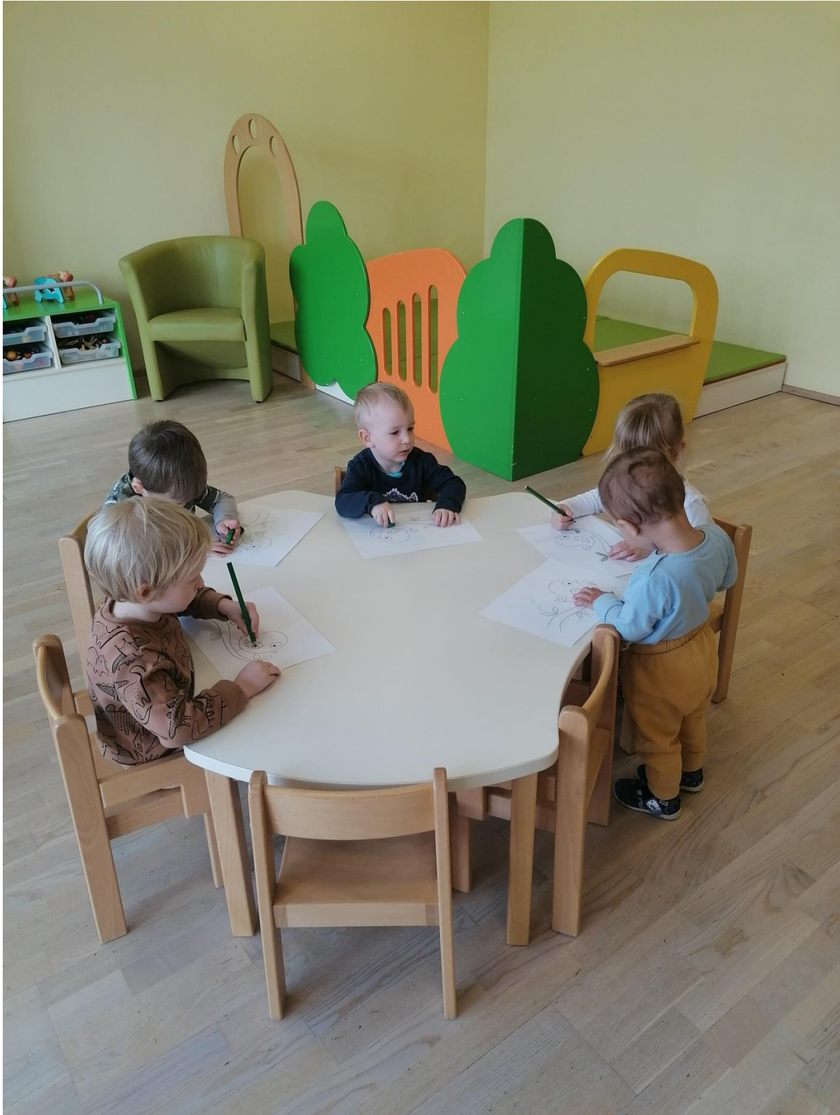
Ptičkom naredimo barvo ;-)