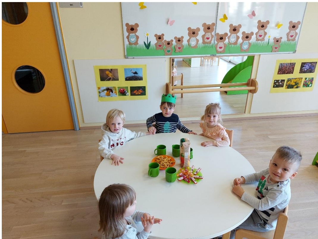
Tudi sladkamo se.